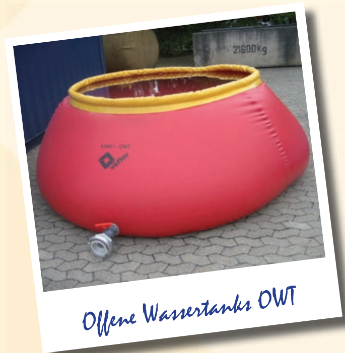
Offene Wassertanks OWT

Die Befüllung und Entleerung der Wassertanks erfolgt über einen 4" Storz-Anschluss. Im Lieferumfang sind serienmäßig eine Packtasche und ein Reparaturkit, sowie ein Übergangsstück von Storz A auf C enthalten. Optional ist der Offene Wassertank auch mit Haltegriffen und Abdeckung erhältlich.